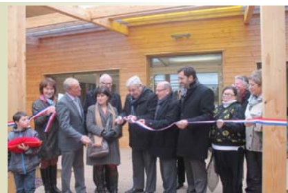
Inauguration de l'Orange Bleue