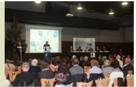
2014 : 50 ans de l'Adapei 04